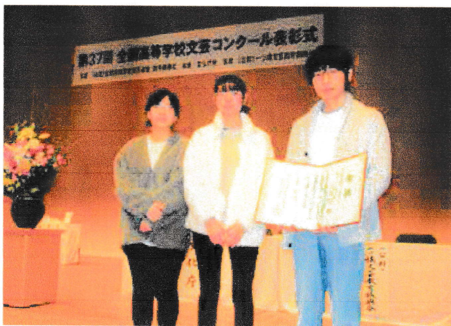
▲文芸部は第37回全国高等学校文芸コンクールで奨励賞を受賞

令和4年も新型コロナが猛威を振るう1年ではありましたが、仙高生はみな「負けてたまるか」と各部とも頑張っています。今回は1面で現役生、8面で同窓生代表の活躍をご紹介します。