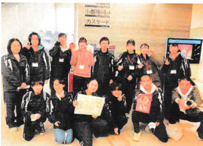
▲演劇部は東北地区高等学校演劇発表会で2年連続の優良賞