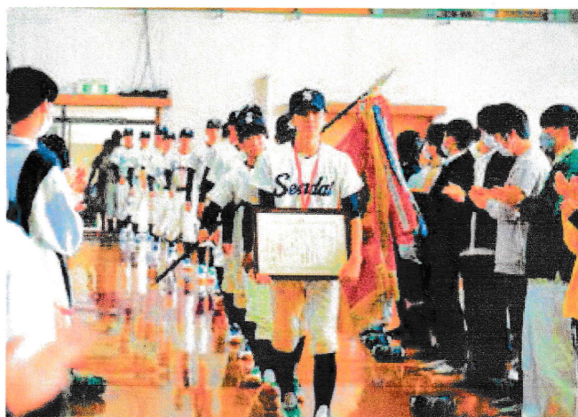
▲軟式野球部は第34回秋季東北地区高校軟式野球大会で優勝